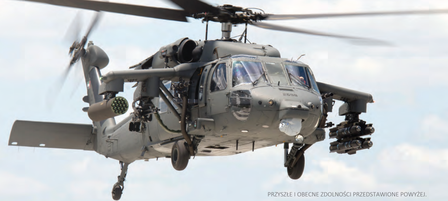
PRZYSZŁE I OBECNE ZDOLNOŚCI PRZEDSTAWIONE POWYŻEJ.