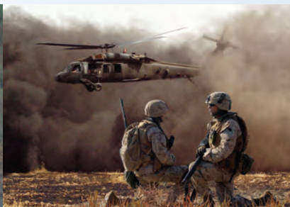
DOWODZENIE I KIEROWANIE