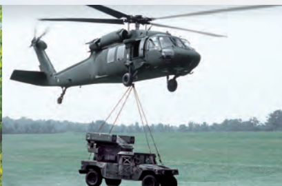
TRANSPORT ŁADUNKÓW PODWIESZONYCH